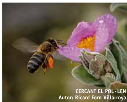
CERCANT EL POL - LEN Autor: Ricard Forn Villarroya