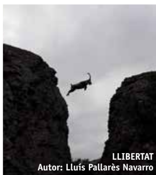
LLIBERTAT Autor: Lluís Pallarès Navarro