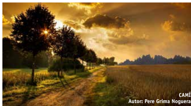
CAMÍ Autor: Pere Grima Noguera