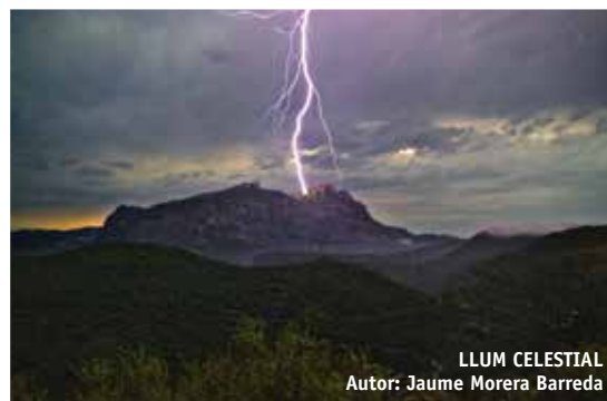
LLUM CELESTIAL Autor: Jaume Morera Barreda