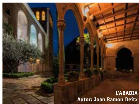
L'ABADIA Autor: Joan Ramon Deïtx