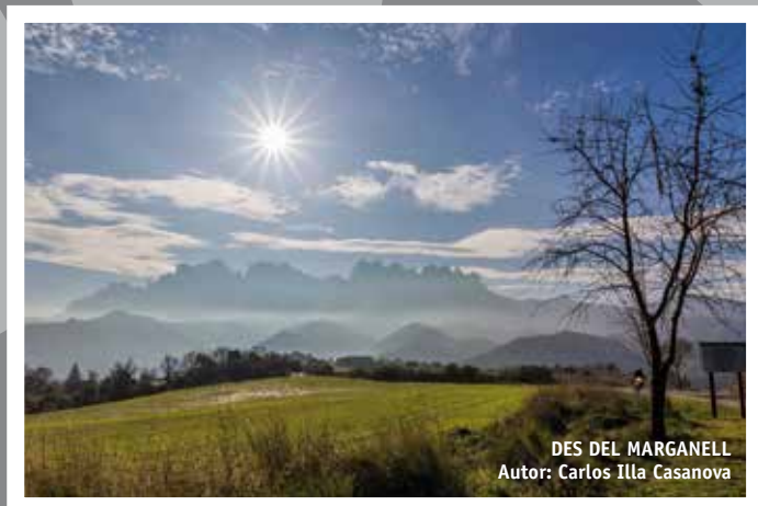
DES DEL MARGANELL Autor: Carlos Illa Casanova